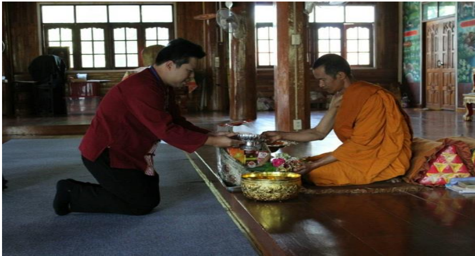
ภาพบุคลากรร่วมทำบุญถวายสังฆทาน ที่วัดดอยแก้ว วันที่ ๗ กุมภาพันธ์ ๒๕๖๓